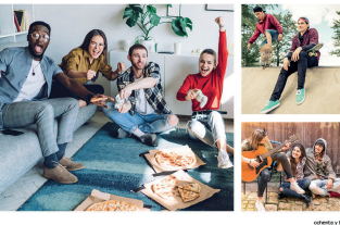
colores y tres 11